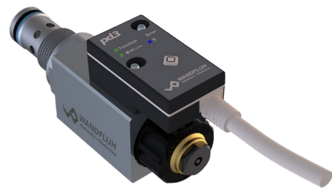
Ventil mit IO-Link-Elektronik (PD3)